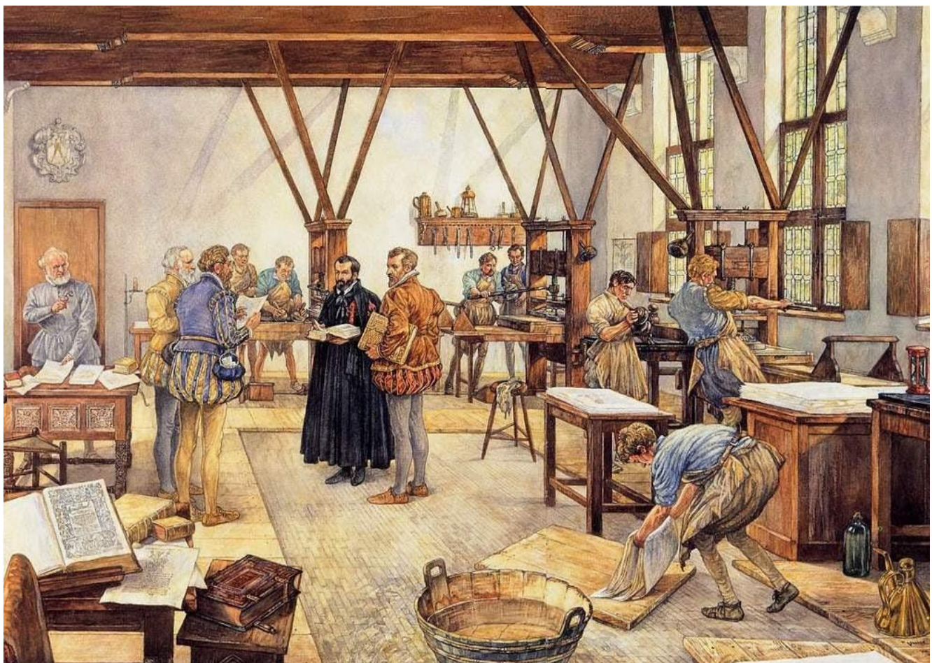
Schoolplaat van Isings

Christoffel Plantijn wordt gezien als een succesvolle drukker / uitgever, die vanaf het begin der boekdrukkunst het grafische vak tot grote hoogte heeft gebracht. Zijn bedrijf in Antwerpen kreeg voornamelijk opdrachten, in zijn tijd was dat het topsegment.